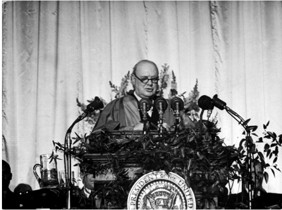
Winston Churchill dando su célebre discurso en Fulton, Missouri, el 5 de marzo de 1945 donde acuñó por primera vez la expresión “ iron curtain ”.

Entre otras muchas cosas que clarifica el libro esta el hecho fundamental de que la Guerra Fría no era evitable, como se ha señalado algunas veces (célebre es la historiografía de Oliver Stone ), sino que los planes de Stalin eran claros y el Terror bolchevique nunca fue ajeno para los grandes estadistas del momento como Kennan , Acheson o el propio Churchill quién primero advirtió y de forma clara sobre los peligros que suponía la Unión Soviética. Un peligro que, en su día no fue tan evidente: célebre se ha convertido ya la admiración hacia el Partido Comunista por parte de intelectuales como Sartre pese a las reprimendas de su contemporáneo Camus , que demostró tener más vista y criterio.